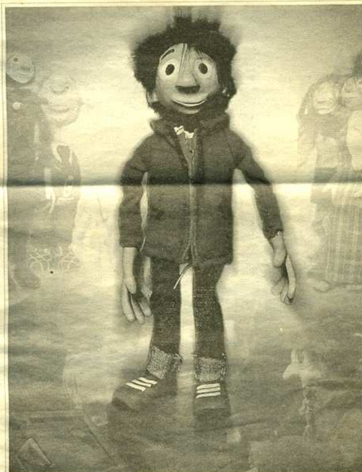
« Les Excuses de Victor » mêle théâtre de marionnettes et vidéo

Dimanche 3 avril , à 16 h 30, à la salle Deltel (rue du 11-Novembre), à Bègles (33). 05.56.49.88.39.