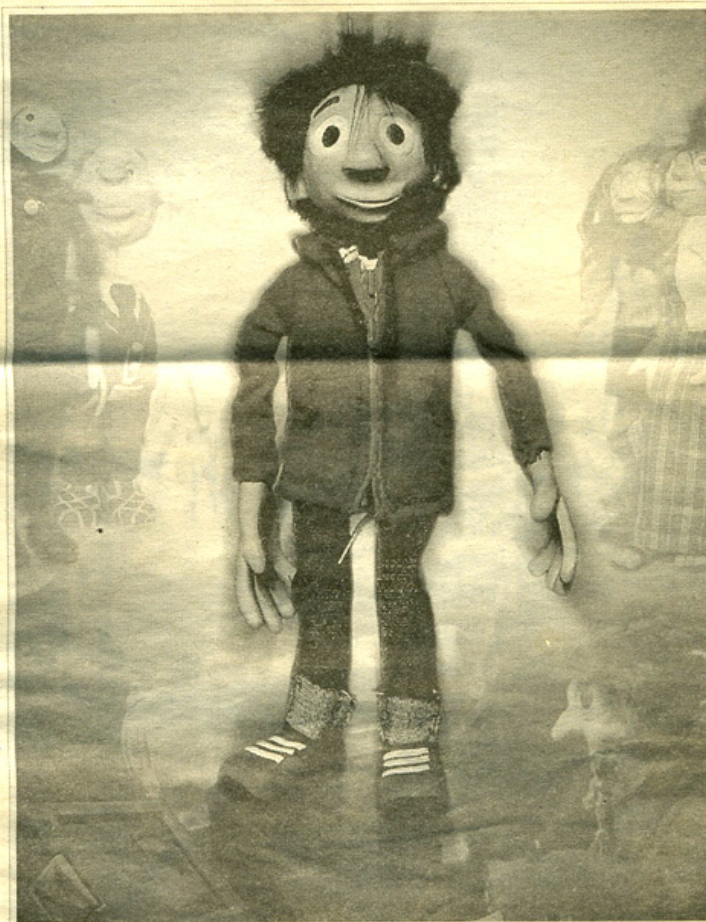
« Les Excuses de Victor » mêle théâtre de marionnettes et vidéo

Dimanche 3 avril , à 16 h 30, à la salle Deltail (rue du 11-Novembre), à Bègles (33). 05.56.49.88.39.